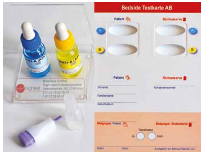
Bedsidetest Karte AB Ref: 90240

für schnellste Tests am Bett des Patienten