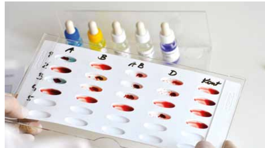
Serowhite 6 Ref: HXSB6 mit Seropad Ref: 90254

für schnellste Tests in der Blutgruppenserologie